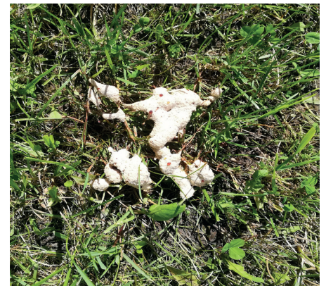
In der Wiese nahe dem Saftladen wurde dieser mysteriöse Haufen gefunden. Art und Herkunft unbekannt - es wollte niemand kosten.