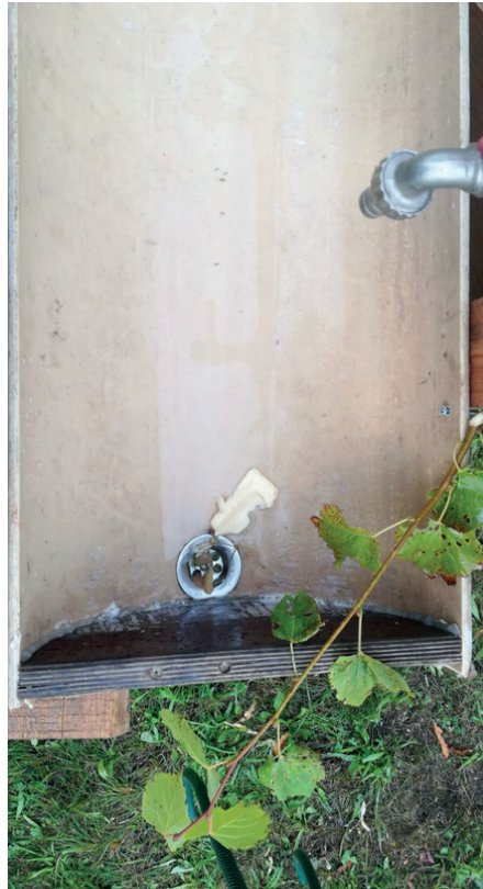
Der Tatvorgang dürfte unmittelbar vor Eintreffen der YSPF passiert sein. Die frischen Spuren wurden gesichert und hoffentlich führen diese zum Don.

Grübelnd wandere ich weiter Richtung San-Zelt und erfahre vom Staff, dass auf den WCs die leeren Klopapierrollen einfach am Boden lagen. Verdächtig, wir Pfadis würden diese natürlich in den Mist-