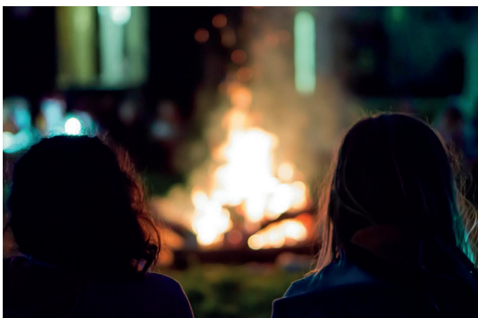
Beim Lagerfeuer kommt romantische Stimmung auf. Vielleicht kommt ihr euch dabei ein bisschen näher.